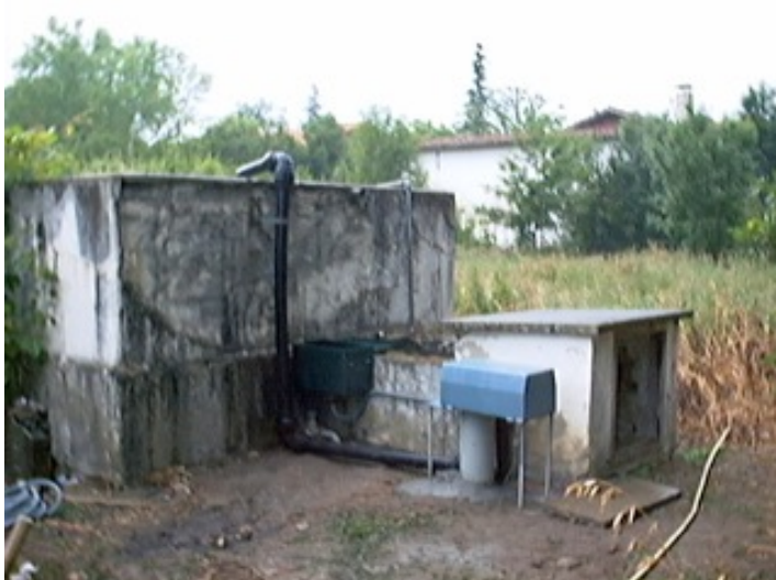
Caseta de bombeo y depósito de aguas en Arkaute