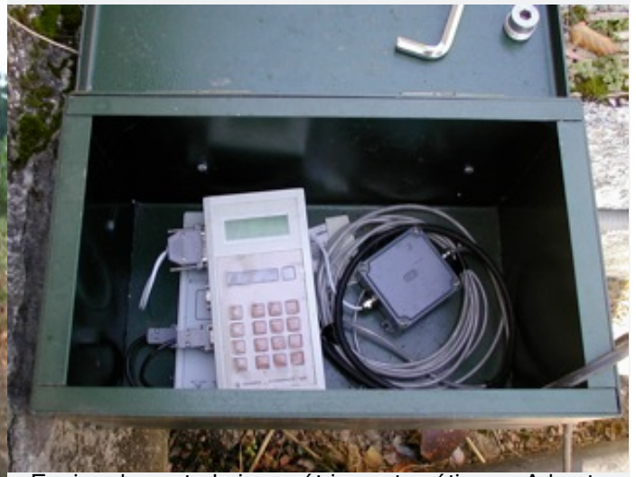
Equipo de control piezométrico automático en Arkaute